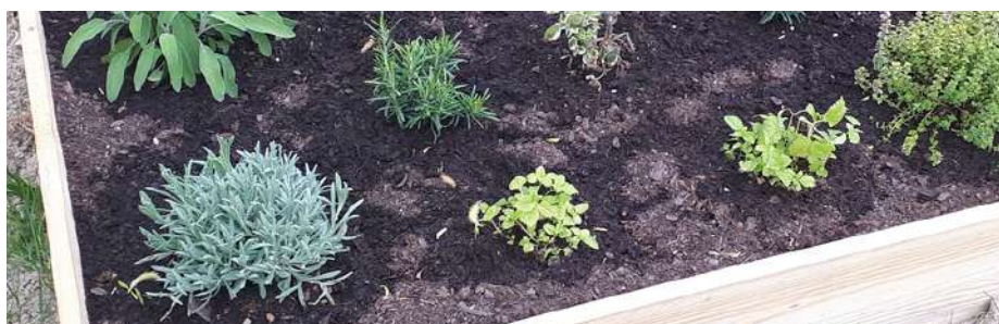
2 | ZAKLADÁME VYVÝŠENÝ ZÁHON

Vytvoriť vyvýšený záhon nebolo nikdy jednoduchšie! Nasadte drevené záhony na seba podľa požadovanej výšky a môžete sa tešiť z novej záhradky.