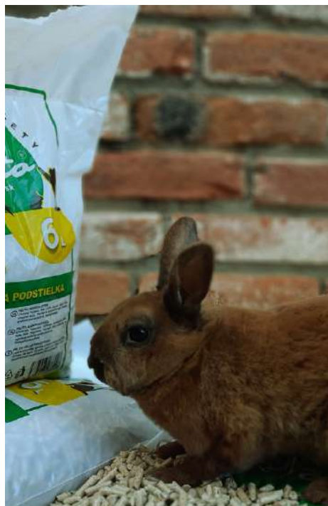
4 | PELETOVÁ PODSTIELKA