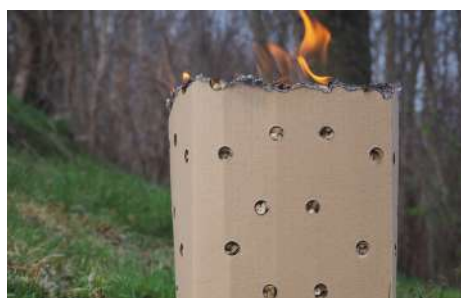
3 | PELETOVÉ BOXY

Pozor na jarné mrazy! Nenechajte sa pripraviť o úrodu. Efektívny a ekologický spôsob prikurovania v ovocných sadoch je spaľovanie drevených peliet v peletovom boxe.