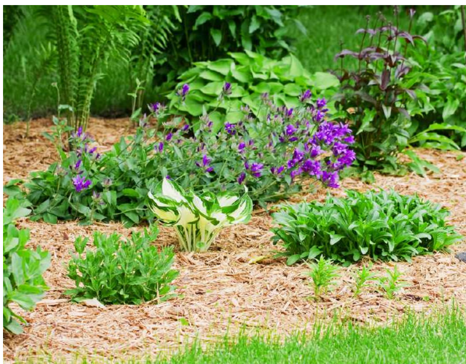
1 | PRÍRODNÉ DREVNÉ ŠTIEPKY

Prírodné záhradné štiepky na úžitkové i dekoračné účely pre údržbu záhrad, mulčovanie, drenáž do kompostu alebo vyvýšených záhonov ale aj povrch na detské ihriská.